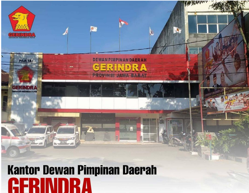
Kantor Dewan Pimpinan Daerah GERINDRA Provinsi Jawa Barat

Jl. Pelajar Pejuang 45 No. 25 Kelurahan Lingkar Selatan Kecamatan Lengkong Kota Bandung